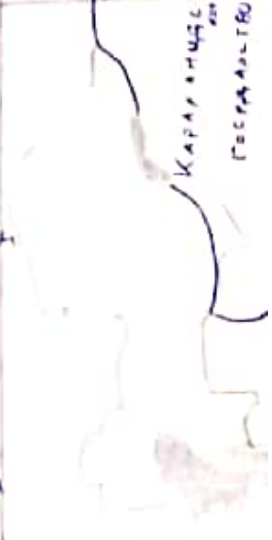
Карта Кипчакского ханства